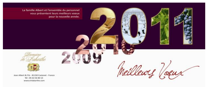
Carte de vœux réalisée au cours de ce stage.

Nous sommes parties d'une couleur rouge et d'une autre bleu-vert à partir d'un nuancier pantone. Mais nous n'avons jamais utilisé ces couleurs. Nous sommes arrivées à des couleurs rappelant le vin : un bordeaux foncé, un autre clair et une couleur dorée. Ces couleurs, l'écriture du domaine et les photos proviennent de la plaquette du site du client.