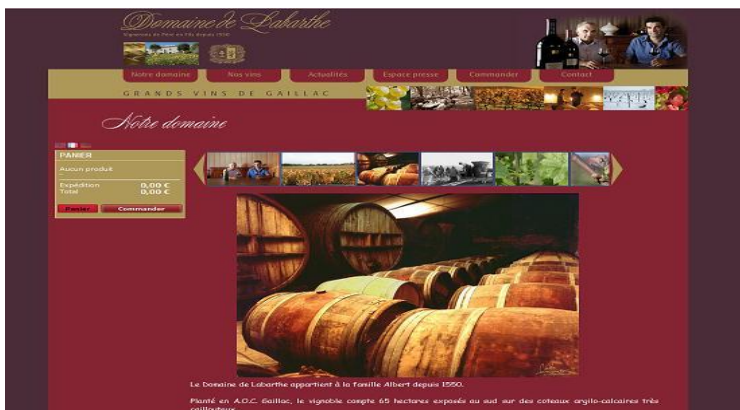
Plaquette du client.